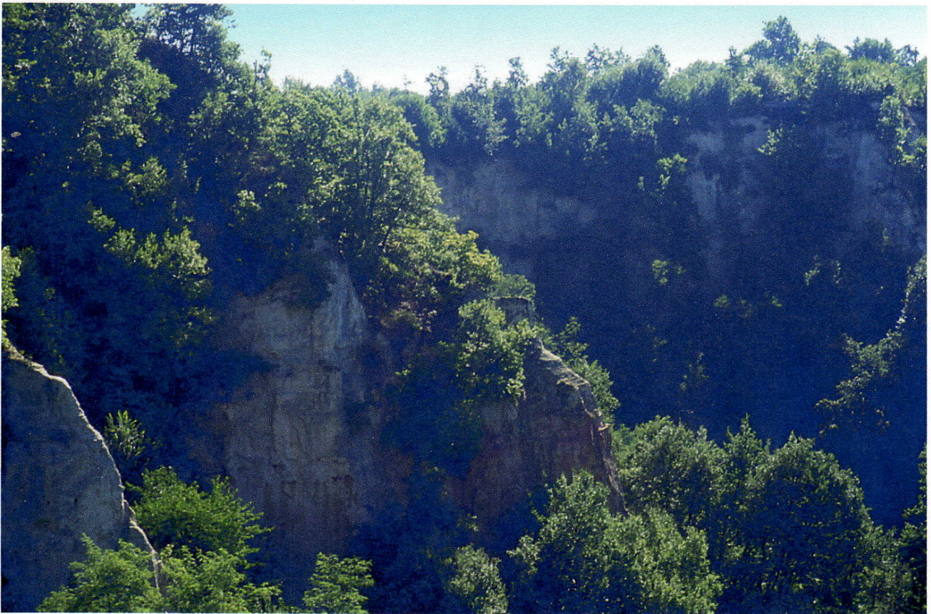
Le rocche a Pocapaglia